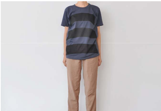
bottom ブルーブラック S サイズ着用 (160cm 女性着用)