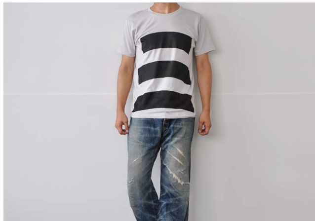
bottom ライトグレイ L サイズ着用 (185cm 男性)